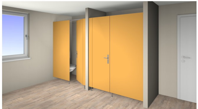
Typ / Type Onyx