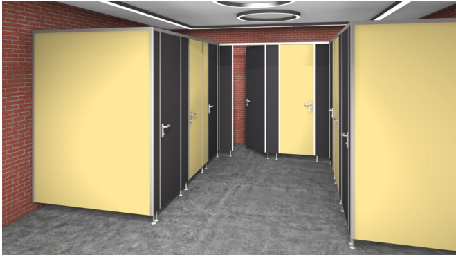
Typ / Type Diamant