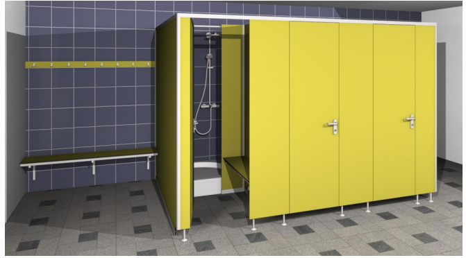
Typ / Type Saphir