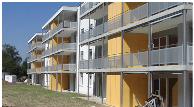
Typ Balkon / Type Balcon