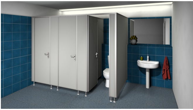
Typ / Type Ecoline