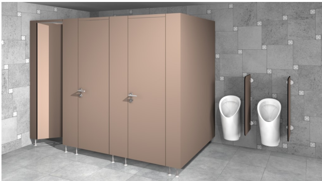
Typ / Type Topas