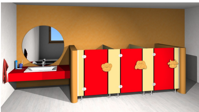
Typ / Type Kidz